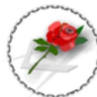
CLIMAF Dachverband europäischer Freimaurerinnen